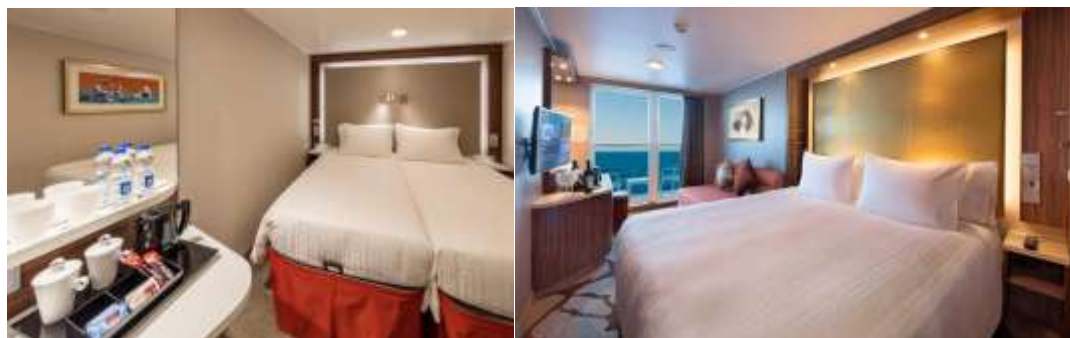
Inside Room / Balcony Room

**โปรดตรวจสอบห้องพักกับเจ้าหน้าที่ทุกครั้งก่อนทำการจอง**