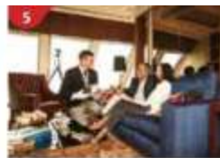
The Palace Indulge in European-style butler service and exclusive facilities.